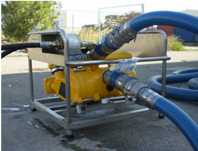
Selwood PD75 Spate con motor hidráulico

Se suministra con motor diesel en chasis con ruedas o con motor hidráulico en chasis con regulador de caudal y sin ruedas.