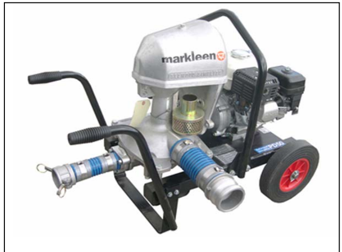
Selwood PD50 Simplite con motor de gasolina